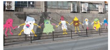
「b.friends on the wall」(ギリシャ) 2010年制作