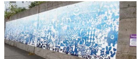
「NAMURA 152P」(日本) 2011年制作